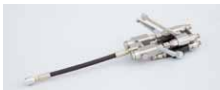
3K-Mischkopf mit Schiebekupplung (System SK)