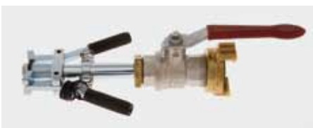
Schnellschnappverschluss (System SSV)