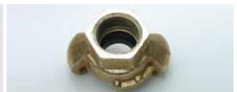
Klauenkupplung (System KK)