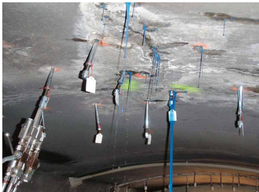
Während des Injektionsprozesses: Anreagiertes Injektionsmaterial. Die Schilder geben zu Dokumentationszwecken die Injektionsreihenfolge vor.