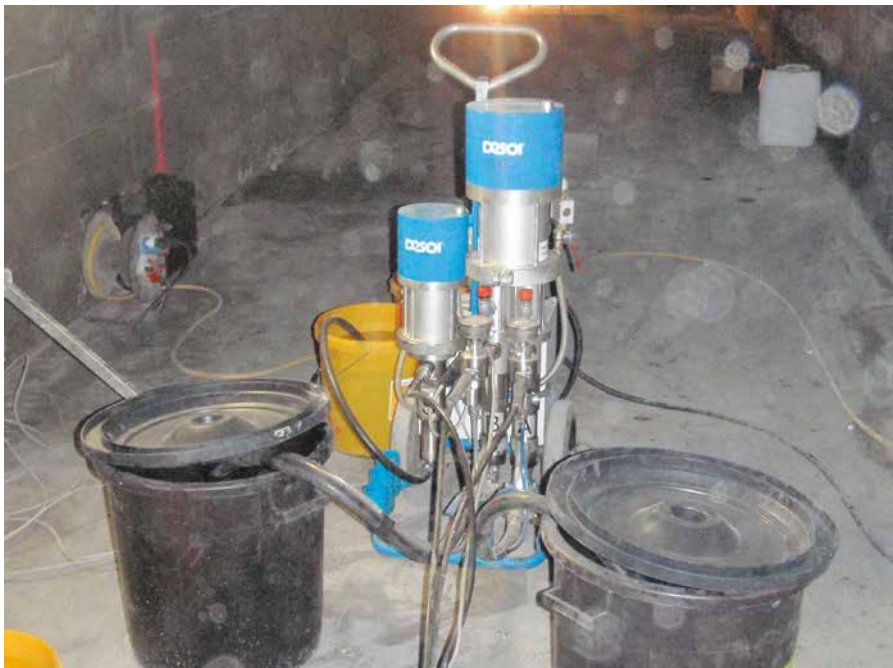
Injektion mit der Kolbenpumpe PN-1412-3K (DESOI AirPower M25-3C VA) und DESOI Flow Control

Die Durchführung ist auf Grund der Verkehrsbelastung nur nachts, außerhalb der Ferien oder von Feiertagen möglich. Eine Tunnelröhre wird vom späten Abend bis in die frühen Morgenstunden gesperrt und der Verkehr wird durch die zweite Röhre mit Begegnungsverkehr geleitet. Ab 21:15 Uhr kann mit der Baustelleneinrichtung begonnen werden. Alle Geräte werden dann installiert und die „Nachtschicht“ beginnt. Um 4:00 Uhr muss der Tunnel geräumt werden, was bedeutet, dass alle losen, beweglichen Teile aus Sicherheitsgründen entfernt werden müssen. Ab 5:00 Uhr läuft der Verkehr wieder normal durch beide Tunnelröhren. Beteiligt an der Umsetzung der erforderlichen Maßnahmen ist neben dem ausführenden Abdichtungsunternehmen SikaBau AG, Niederlassung Cadenazzo (SikaLavori SA), dem Materiallieferanten MC Bauchemie auch das Unternehmen DESOI GmbH, das unter anderem insgesamt fünf Injektionsgeräte mit der Aufzeichnungseinheit Flow Control für Acrylatgel (MC-Injekt GL-95) und mehrfach verwendbare Injektionspacker geliefert hat. Das DESOI Flow Control, eine 2-Komponenten-Injek-