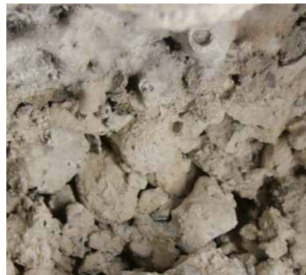
Undichtigkeiten auf Grund der Betonqualität

Die Arbeiten wurden von SikaLavori SA durch die ARGE „Consortio Risanamento Galleria Melide-Grancia“, unter Federführung der Firma Edilstrada SA (Bedano) vergeben. Unter dem Dach der ARGE arbeiten die Firmen: Edilstrada SA (Bedano), Ferrari Ennio SA (Lodrino), LGV Impresa costruzioni SA (Bellinzona).